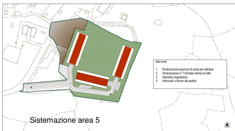
Sistemazione area 5