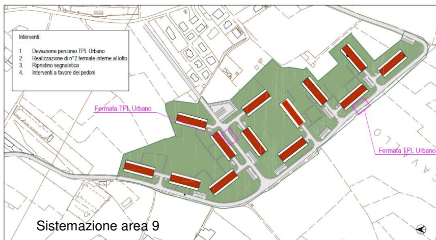
Sistemazione area 9