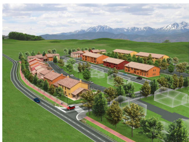
Visione 3d di un'area realizzata