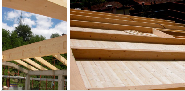
COPERTURA IN LEGNO LAMELLARE