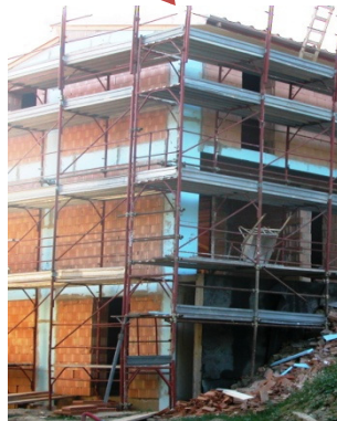
RIDUZIONE PONTI TERMICI su elementi puntuali in ca