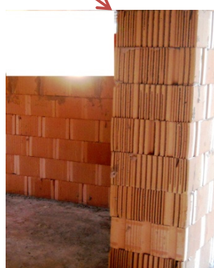
TAMPONATURE CON ALTE PRESTAZIONI U = 0,27 \text{ W/mq K}