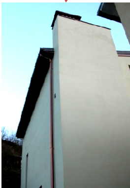
CAVEDIO IMPIANTI eliminazione discontinuità termiche