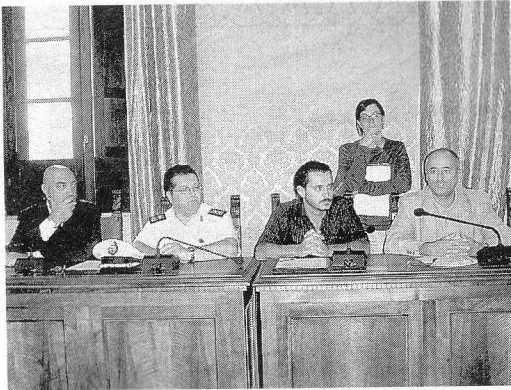
La conferenza stampa di bilancio dell'iniziativa e il bus anti-sballo organizzato da Comuni e Provincia